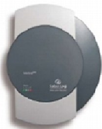
Solar-Log™ 200 für 1 Wechselrichter