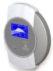
Solar-Log™ 1000 für über 10 Wechselrichter