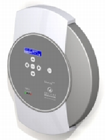
Solar-Log™ 500 für bis zu 10 Wechselrichter